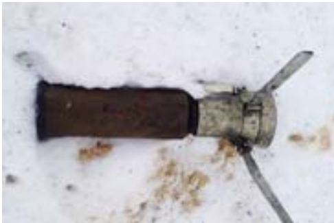
Реактивні гранати, артилерійські снаряди та снаряди реактивної артилерії