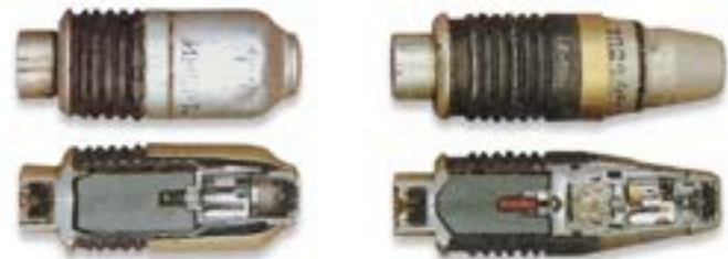
Гранати до протипіхотних гранатометів