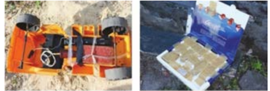
Спеціально встановлені вибухові пристрої (міни-пастки), замасковані (вмонтовані) в дитячі іграшки, коробку з-під цукерок, пакунок та пластик